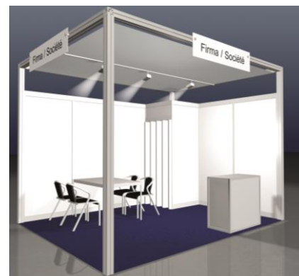
Beispiel: COMFORT, 12 m 2 Eckstand