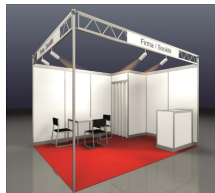
Beispiel: BUDGET, 12 m 2 Eckstand