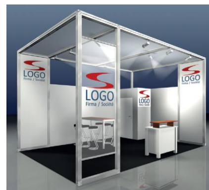
Beispiel: DELUXE, 24 m 2 Eckstand